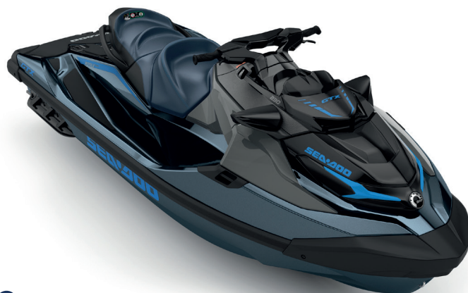
Blue Abyss / Gulfstream Blue