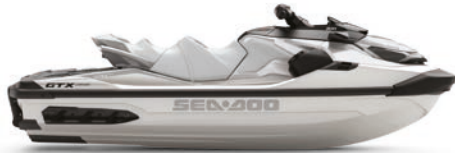
○ NYHET – White Pearl Premium