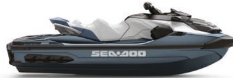
● Blue Abyss